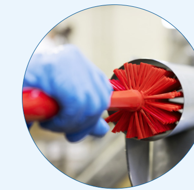
Rörborste i ett

Dessa borsthuvuden är utformade för rengöring av längre raka eller lätt böjda rör, som exempelvis nivåmätare i tankar, och passar på alla flexibla skaft från Vikan. Välj bland våra flexibla nylonskaft till rör med känsliga väggar.