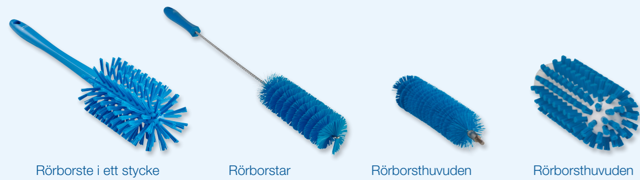
Rörborste i ett stycke